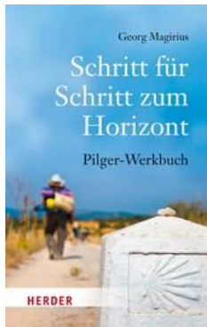
Schritt für Schritt zum Horizont ISBN 978-3-451-31311-0 17,99 €